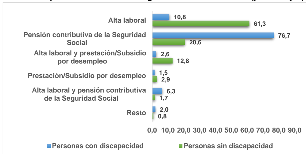
Gráfico 1 Tipo de relación con la Seguridad Social. Año 2022 (porcentajes).